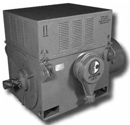
Структура условного обозначения двигателей типа АК4